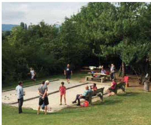
▼ Concours de pétanque