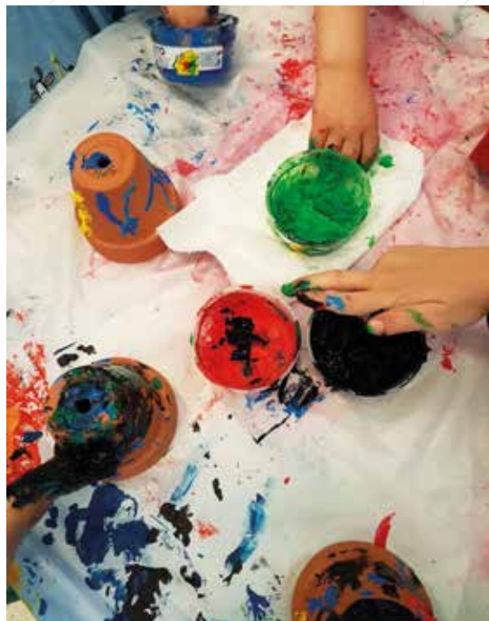
Atelier peinture au local du Couffin, Route d'Avully 33

Nous proposons toutes sortes d'accueils. Pour des accueils courts, tels qu'un accueil en soirée ou un dépannage durant les vacances scolaires, nous avons un service de baby-sitting. Une trentaine de baby-sitters, tous au bénéfice de la formation de la Croix-Rouge, sont à votre disposition. Pour les accueils de longue durée, ce sont des accueillantes familiales qui vous sont proposées.