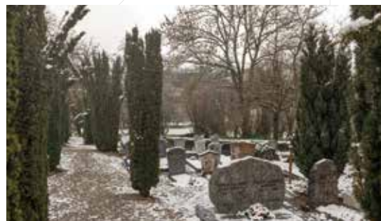
▼ Cimetière d'Avully

Les monuments et entourages des tombes non renouvelés devront être enlevés avant le 31 mars 2019.