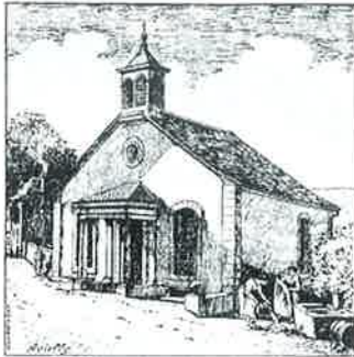
Au début du 20 ème siècle