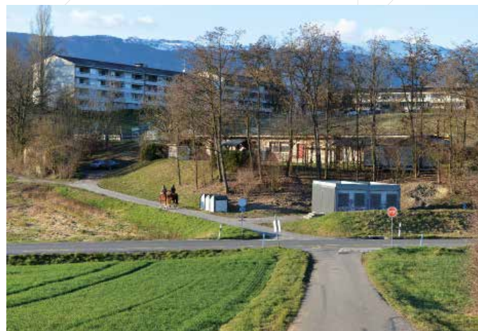
Le Jardin Robinson en 2016

En 1976, après moult péripéties et un fort soutien de la majorité des élus de l'époque (Madame le Maire en tête), le Jardin Robinson, structure d'encadrement pour enfants et adolescents, vit le jour sur un terrain où tout était à faire, avec les moyens du bord. C'est qu'il ne fallait pas trop dépenser l'argent alloué au Jardin et à son fonctionnement ainsi que donner les preuves de la viabilité du projet.