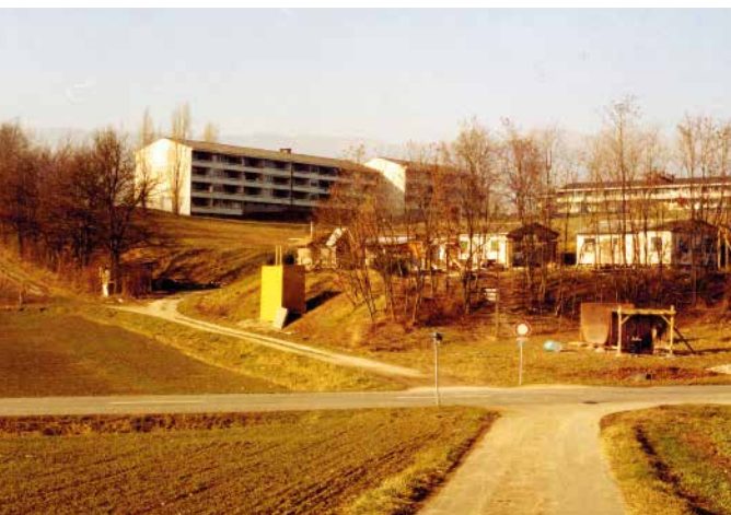
Le Jardin Robinson en 1976

Situé en contrebas du stade de football, le Jardin Robinson est né de la volonté de quelques parents de mettre à disposition un espace répondant au principe qui permet à l'enfant de se développer en laissant libre cours à son imagination, de jouer avec des éléments naturels avec peu de contraintes, tout cela dans un esprit d'aventures et de découvertes.