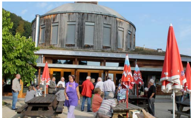
Sortie des aînés 5 septembre 2014