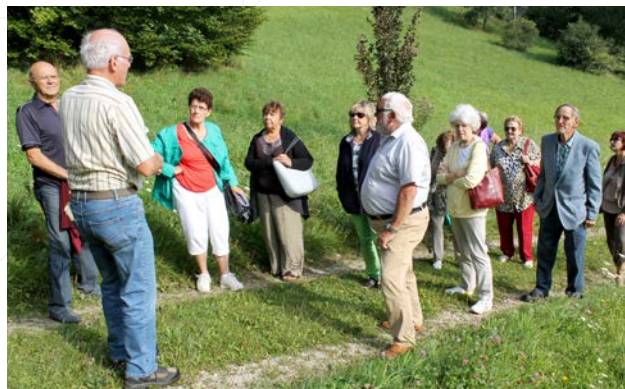
Sortie des aînés 5 septembre 2014