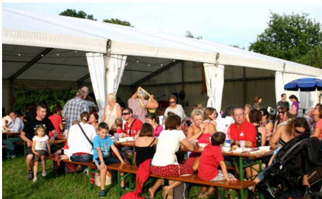
Fête nationale du 1 er Août