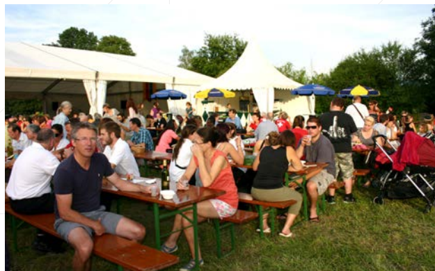
Fête nationale du 1 er Août