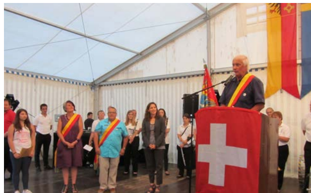
Fête nationale du 1 er Août