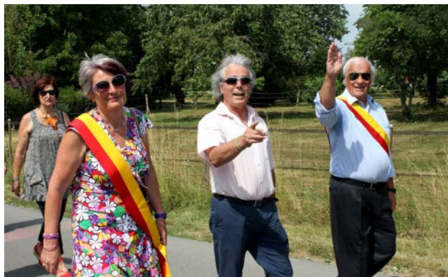
Fête des Promotions 28 juin 2014