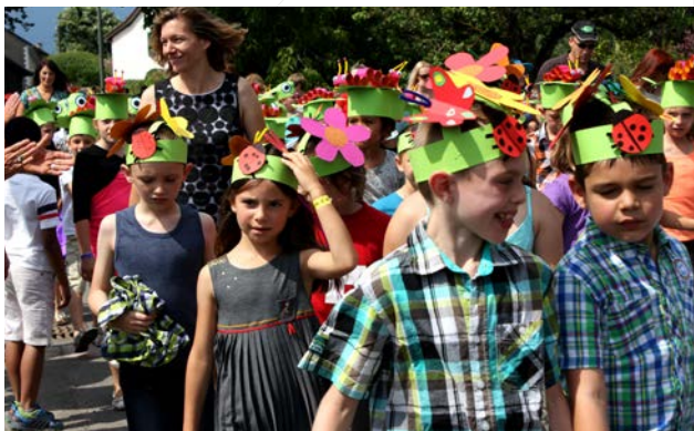
Fête des Promotions 28 juin 2014