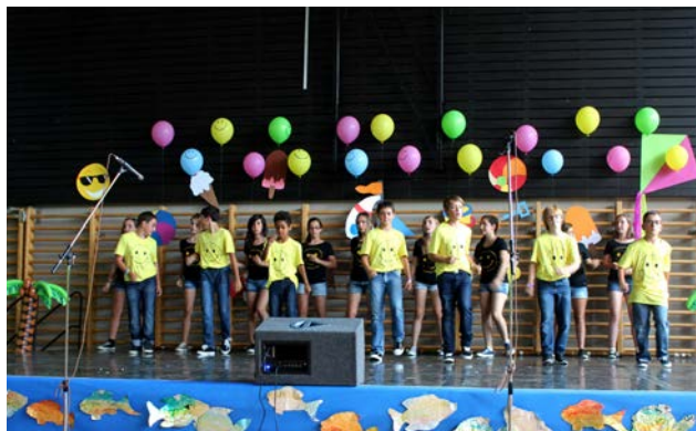
Fête des Promotions 28 juin 2014